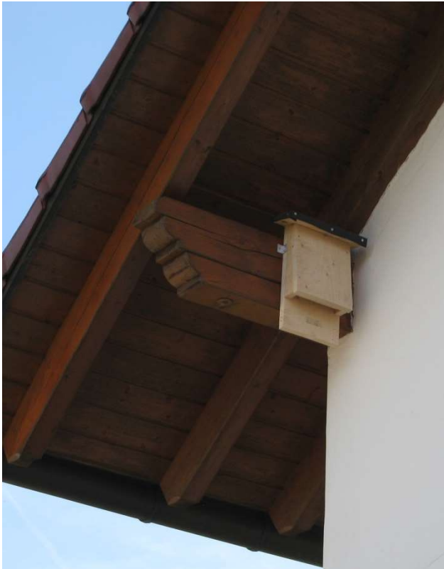
Beispiel für das Anbringen eines Fledermauskastens